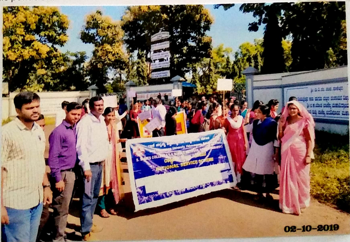
Awareness rally on 'Anti Plastic' on 02.10.2019

About 70 NSS volunteers' and 250 students took part in the mega awareness rally organized by the S. S. Arts College & T.P.Science Institute, Sankeshwar to sensitize people against the use of plastic items. Our volunteers' collected Plastic items at Mahadev Nagar Sankeshwar to save our future from plastic pollution.